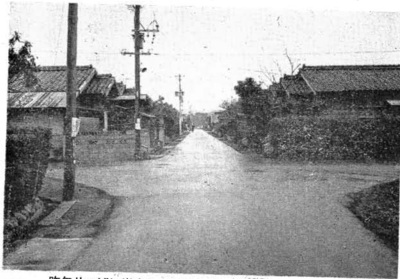
昨年りつばに出来た古町住宅市道舗装

償問題、その他関連する問題については、県、国に対し、最善の努力をいたしたいと存じております。このほか、開発公社の運営を一層能率的にし、資金運用の円滑化をはかるため、金融機関に対し、一千万円の預託をすると共に、別途五千万円の貸付けを行なう事業の推進をはかります。土木行政については、前にも述べましたとおり、前年度に引き続き、道路舗装、排水施設等を舗装五カ年計画とも合わせて、重点的に実施するほか、都市計画事業として、西三城、杭出津線の新設に伴う用地買収、および、物件移転等を早急に解決し、街路築造をするほか、桜馬場に児童公園一カ所の新設を計画いたしました。また、交通安全施設整備事業として、前年度に引き続き市道乾馬場線の歩道整備、また、防衛施設周辺整備事業として、西小路排水路の整備を行なう予定であります。次に単独事業としては、市道並びに急坂路舗装を、また、新設改良事業では、松原神社、草場緑等の拡幅改良と、森園排水路、ほか河川のしゅんせつ改良を実施し、