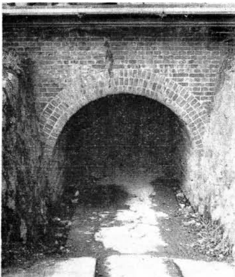
大村駅線路下トンネル小佐古側入口

大村駅線路下隧道は、駅前と、駅裏部落、に通ずる通用道路として、一般市民が多く利用しておりますが、最近その道路に、ゴミを捨てたり大 小便を行なうなど、心ない人がいるため、悪臭等発生してきたなくよこされています。お互いに注意し合い、きれいな環境に心がけましょう。