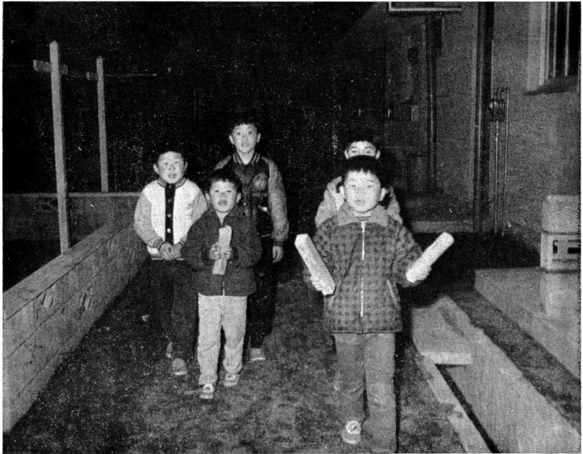
小路口アパートにて

オーイ!!みんな集れ……と、リーダーが呼びかける。ほこらしげに拍子木を「カチカチ」とならしながら5人がそろそろ、さあ、始めよう……。今夜は少し寒いなと、誰かが言う、「なんのなんのこれしきの寒さ」とリーダーが元気をつける。