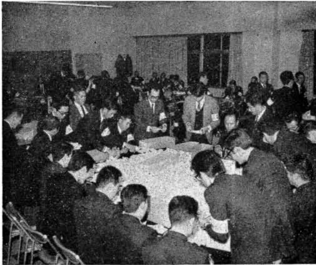
昨年12月衆議員選挙開票から