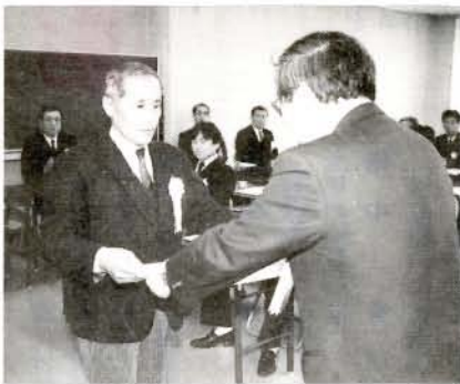
写真コンテスト表彰式 (2/2・市コミセン)

第2回国民年金写真コンテストで、応募作品119点(41人)の中から次の方々が入賞されました。おめでとうございます。なお、入賞作品は、年金制度広報等PRのため利用させていただきます。