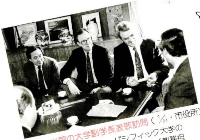
▲米国の大学副学長表敬訪問 (1/21・市役所)

米国のシアトル・パシフィック大学のデビッド・O・ディッカーソン(教務担当)と、ドナルド・W・モルテンソン(財務担当)の両副学長が1月21日、市役所を表敬訪問されました。同大学は、向陽学園(烏山英也理事長)が誘致を進めているもので、松本市長も「学園都市については、市民の関心も高い。できるだけの協力をしたい」とあいさつしました。