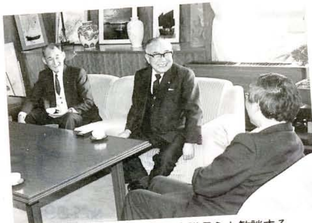
松本市長、中瀬前市議会議長らと歓談する 柴田町長(中央)……(右)・市役所

開業後は、普通列車が停車することになりますので、多くの皆さんのご利用をお願いします。