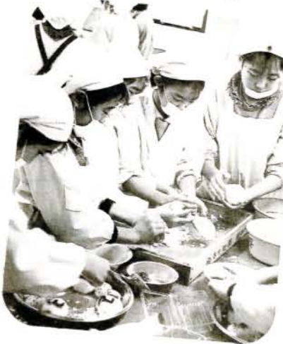
▶食欲満点 (1/22・市コミセン)

米の消費拡大あるいは、米飯の良さを認識しようと、1月22日、第9回おにぎりコンクールが、市コミセンで行われました。小学生の部、ファミリーの部と計31チーム・134人が参加。チームワークのとれた、おいしいおにぎりが出来あがり、また、我が家のごはん料理コンテストや、米の料理講習会なども行われました。