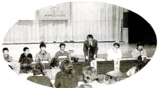
▲魅力ある子ども会を(2/6・市コミセン)

米の消費拡大あるいは、米飯の良さを認識しようと、1月22日、第9回おにぎりコンクールが、市コミセンで行われました。小学生の部、ファミリーの部と計31チーム・134人が参加。チームワークのとれた、おいしいおにぎりが出来あがり、また、我が家のごはん料理コンテストや、米の料理講習会なども行われました。