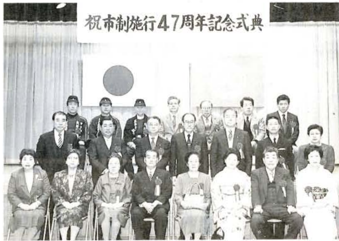
祝市制施行47周年記念式典