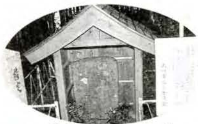
珍しいカマボコ型の墓 「今富キリシタン墓碑」(今富町)

広く皆さんに、文化財愛護の心を高めてもらうために、この週間が設けられています。大村市には古い時代から祖先が残してくれた国民的財産が多くあります。これ等を、私たちは愛護し災害などから守り、後世へ伝えなければなりません。皆さんのご理解とご協力をお願いします。