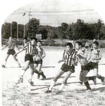
中学生サッカー大会

優勝…郡中 うかな。 ロールは、ちよつと勝手が違うかな。 手と違つて、足でのコントロールは、ちよつと勝手が違うかな。 市営サッカー場) 10%・浄水管理センター内