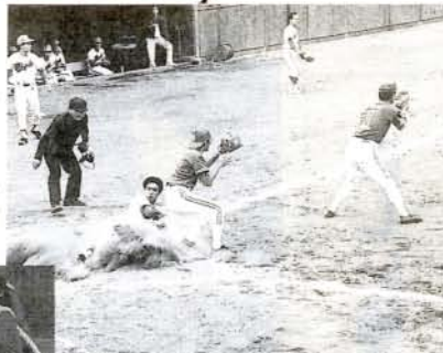
ソフトボール (市営球場)