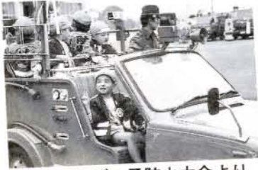
昨年の子ビッチ防火大会より