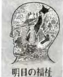
明日の福祉 ポスターの部 中窪健一さんの作品 (大中3)