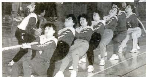
綱引き(玖島中学校)

優勝…郡中 うかな。 ロールは、ちよつと勝手が違うかな。 手と違つて、足でのコントロールは、ちよつと勝手が違うかな。 市営サッカー場) 10%・浄水管理センター内