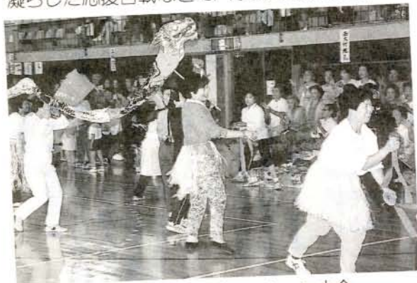
市連合婦人会レクリエーション大会

▼ママさんもハッスル (1%・市民体育館) 三浦から松原まで、8地区の婦人会の皆さんが大集合。アベック競走やリレー、ダンス、そして趣向を凝らした応援合戦などでハッスルしました。