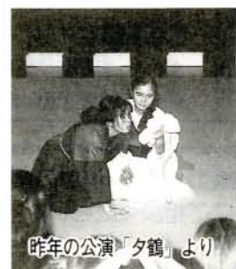
昨年の公演「夕鶴」より