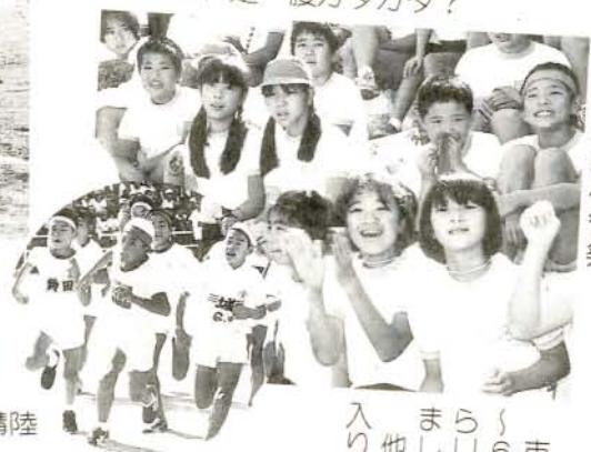
市内小学校体育祭

(1%・大川田町運動会より) 各町内会のカラーを出した競技で、より一層の親睦を深めました。明日は、足・腰ガタガタ?