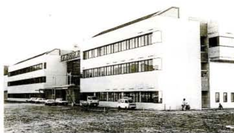
高度技術の向上と地域技術の結集を目指す県工業技術センター(左)と高度技術開発センター(大村ハイテクパーク・池田2丁目)

大村ハイテクパーク(池田2丁目)に建設が進められていた、県工業技術センターと、併設のナガサキ・高度技術開発センターが完成、10月21日から操業が開始されました。 技術センターは、エレクトロニクスをはじめ、さまざまな分野での技術革新が進む中、より高度な技術力の向上を目指しながら、地域企業を支援する、中核的施設となります。 開発センターは、産学官の共同研究や技術開発などの促進を図るための施設で、ナガサキ・テクノポリス財団が運営します。 また、同施設には、発明協会と溶