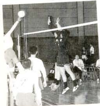
スポ少バレーボール大会

▶ ナイスアタック!! (10%・市民体育館) スポーツ少年団の中学生 男・女29チームが参加。 優勝…(男)朝風(宣瀬)、(女)諏訪