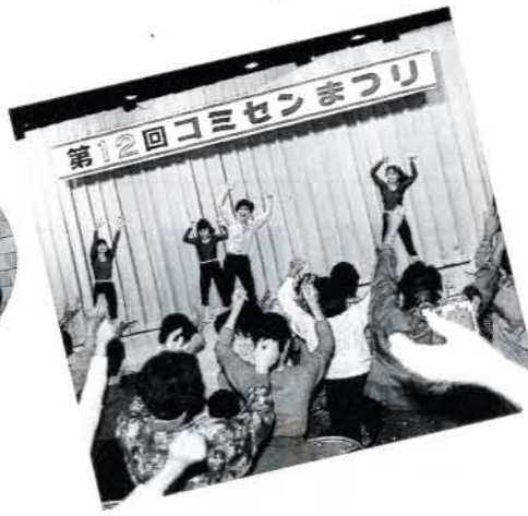
▲ますます盛んグループ活動 (10/19・21・市コミセン) 市コミセンを定例的に利用している90余団体のグループが、日ごろの成果を発表する第12回「コミセンまつり」が、10月19日〜21日までの3日間行われました。舞台発表から展示発表、バザーなど、各グループの生き生きとした活発な活動が如実に伝わり、すばらしい発表の場となりました。