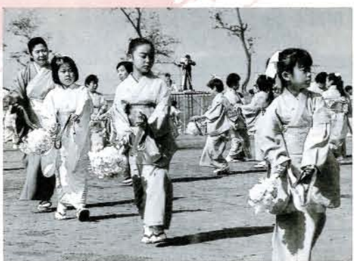
▲日舞道行 大村藤間流五社中、藤間流紅の会による日舞、今回は、大村で研修中の中国上海県の産業技術研修生も友情出演されました。