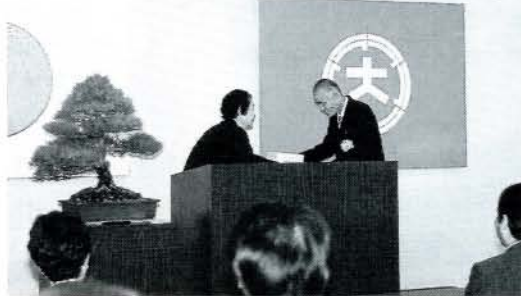
教育・文化の振興に寄与された8個人、5団体などが表彰を受けられました。(11/1・市役所)

本市の教育・文化の振興に寄与された8個人、5団体、および永年勤続など、今年度の教育功労者表彰式が11月1日、市役所で行われました。表彰を受けられた皆さんは、次の方々です。(敬称略)