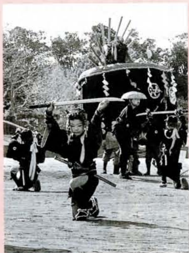
▲沖田踊 黒丸踊、寿古踊と同じ由来を持ち、別名なきなた踊りといわれているそうです。