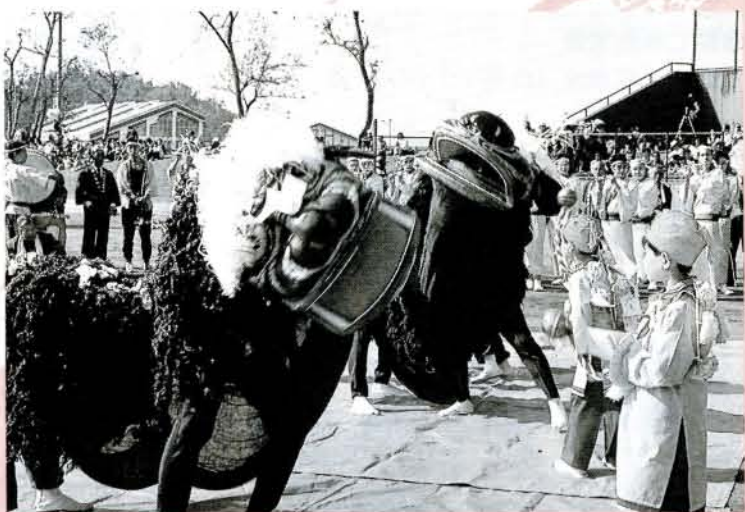
▲獅子舞 怖いような、そして、ちよつぱり愛きょうのある親獅子、子獅子の息の合った演技を披露しました。