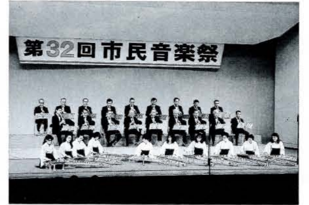
▲バラエティーあふれた音楽祭 (10/27・市民会館)

古賀島町東町内会では11月9日から11日まで、町内文化祭でにぎわいました。公民館活動の一環として、町内会の親睦と活性化を図ろうと、10数年前から開かれているそうです。幼稚園児が描いた絵や小学生の書道、趣味を生かした手芸、博多人形、菊など約300点が所狭しと展示され、来訪者の目を引きつけました。