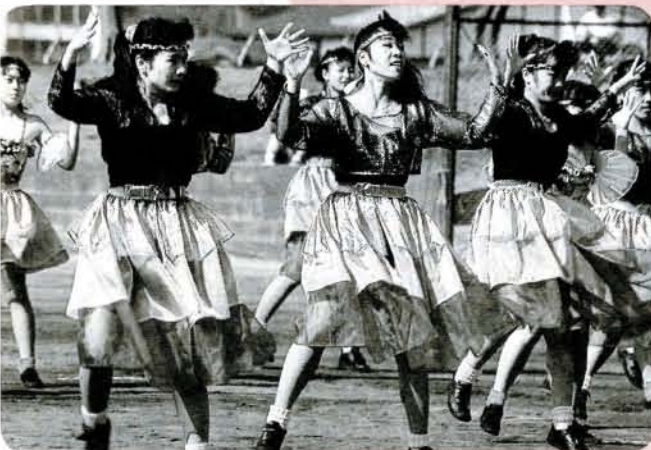
▼民踊道行 連合婦人会、民踊協会、民踊愛好会、農協婦人部の総勢350人の皆さんによる道行。