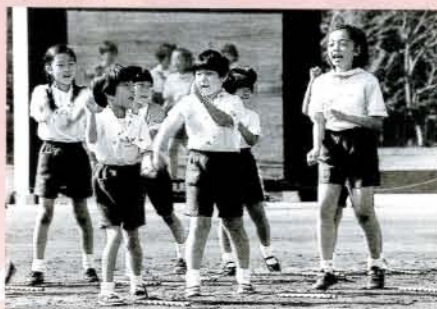
▲ガールスカウト 楽しく踊ります。後方は、今回初めてお目見えたオーロラビジョン。