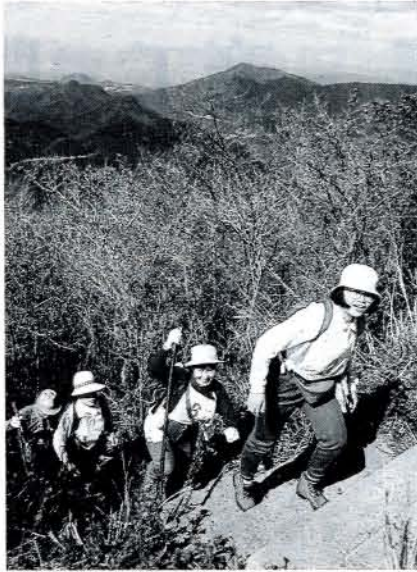
▲多良山系に挑戦 (10/20・五ヶ原頂上付近) 多良山系を歩く市民の会は10月20日、同火口壁ウォークラリーで、秋の

参加したのは、保育所(園)の21クラブの年長者など約600人。消防についての説明や一斉放水などの見学のと、はしご車・化学車との綱引き、大型水鉄砲、人間もぐらたたきなどに挑戦、元気な歓声が響いていました。