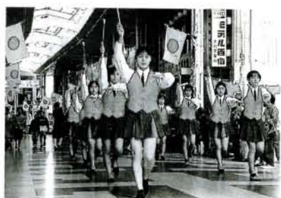
▲チアリーダー 向陽高校の生徒の皆さんによる若々しい演技です。