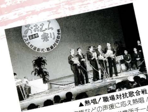
▲熱唱！職場対抗歌合戦 同僚や家族などの声援に応え熱唱！優勝は、県交通局大村営業所チームでした。