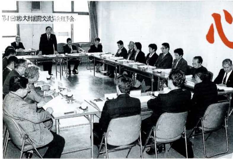
第1回(助)大村国際交流協会理事会