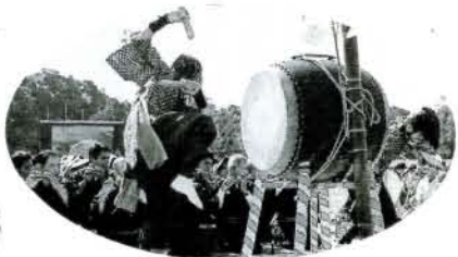
▼荒瀬浮立 約三百数十年前から伝えられている郷土芸能、笛や太鼓のリズムに乗って、ダイナミックに踊ります。