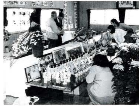
▲公民館活動として文化祭開催 (11/9~11・古賀島町東公民館)

古賀島町東町内会では11月9日から11日まで、町内文化祭でにぎわいました。公民館活動の一環として、町内会の親睦と活性化を図ろうと、10数年前から開かれているそうです。幼稚園児が描いた絵や小学生の書道、趣味を生かした手芸、博多人形、菊など約300点が所狭しと展示され、来訪者の目を引きつけました。