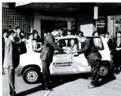
堀会長(左)より首藤会長へ軽自動車のキーが手渡されました (11/1・福祉センター)