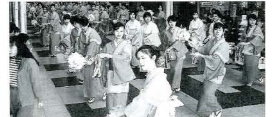
おむら祭りに参加した中国上海県の産業技術研修生の皆さん (11/3・本町2丁目アーケード)