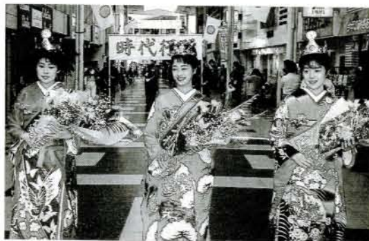
▲ミス大村パレード '91ミスの皆さん。端整な面持ちと華やかな衣装がひときり目を引きます。