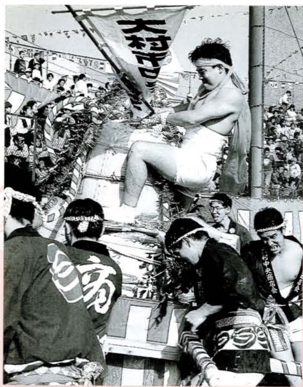
▲樽みこし 子供から女性も加わっての勇壮な樽みこし。10団体約500人が出場しました。 ワッショイ・ワッショイ、まわせ！まわせ！

演じた時代行列、伝統芸能では荒瀬浮立や沖田踊、獅子舞、このほか、若さみなぎる樽みこし、子供に人気のカーニバルなど、市内を練り歩きながら祭り会場へと向かいます。 そして、今回はエアショーも加わり、上空から5人のダイバーが次々と降下、命がけのショーに祭りも最高潮。 さわやかな秋空の中、会場の市営野球場には大勢の観客が詰めかけ、おおむらの祭りを満喫しました。