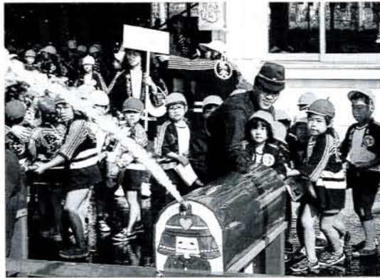
▲遊びを通して防火意識 (10/25・県消防学校)

遊びを通して消防の理解、火遊びの防止、防火に対する知識を持ってもらおうと10月25日、「ちびっ子防火大会」が県消防学校で開かれました。