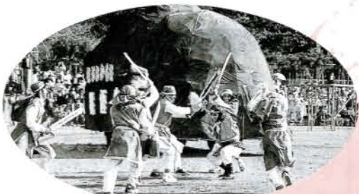
▲カーニバル 子どもに大人気。今回は大村駐屯2部隊が、趣向を凝らしたカーニバルを披露しました。