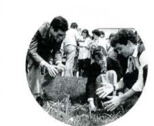
昨年8月ポルトガルを訪問した「大村少年使節団」