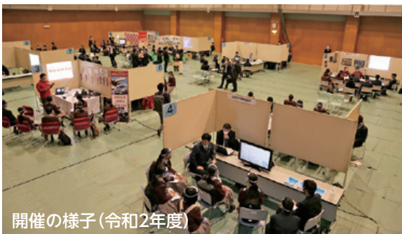
開催の様子(令和2年度)