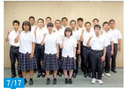
7/17 全国大会に出場された、大村工業高校のソフトボール部、バレーボール部、アーチェリー部、体操部、銃剣道部の皆さん。