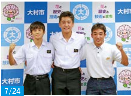
7/24 新島杯九州ジュニアラグビーフットボール競技大会(大分県)に出場された、長崎ラグビースクールの皆さん。