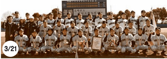
大村工業高校バレーボール部(春の高校バレー) ソフトボール部(全国高校選抜大会)日本一!