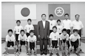
第32回全日本バレーボール小学生大会(神奈川県)に出場した大村男子バレーボールクラブの皆さん (7月23日)