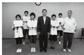
全日本少年少女武道(剣道)練成大会(東京都)に出場した大村剣協チームの皆さん (8月7日)