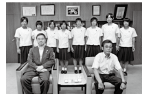
全国高等学校総合体育大会ソフトテニス競技(新潟県)に県代表として出場した大村高校女子ソフトテニス部の皆さん (7月25日)