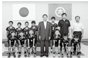
第27回全九州小学生バレーボール男女優勝大会(熊本県)に出場した富の原男子バレーボールクラブの皆さん (7月23日)