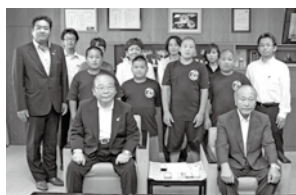
第28回わんぱく相撲全国大会(東京都)に出場した市内の小学生の皆さん (7月27日)