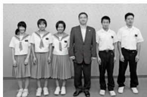
全日本少年剣道練成大会(中学生団体の部、東京都)に出場した放虎原少年剣道クラブの皆さん (7月13日)