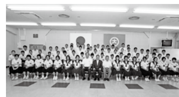
平成24年度九州中学校総合体育大会、全国中学校総合体育大会に県代表として出場した市内中学生の皆さん (8月2日)