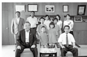
第12回全日本少年少女空手道選手権大会(東京都)に出場した勝和会空手道の皆さん (7月30日)