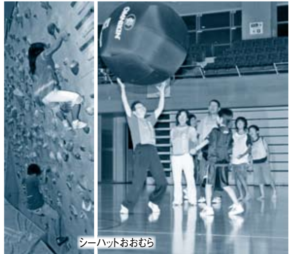
シーハットおおむら