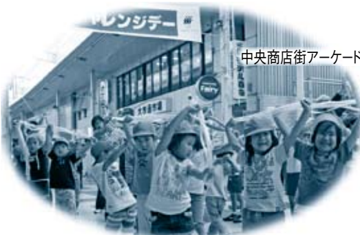
中央商店街アーケード