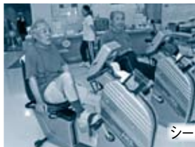
シーハットおおむら