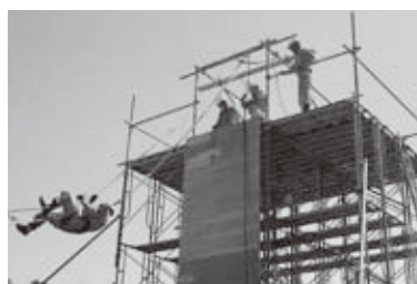
◎ヘリコプターや消防車両、その他防災関係機関の特殊車両なども参加しての総合訓練です。ぜひこの機会にご観覧ください！