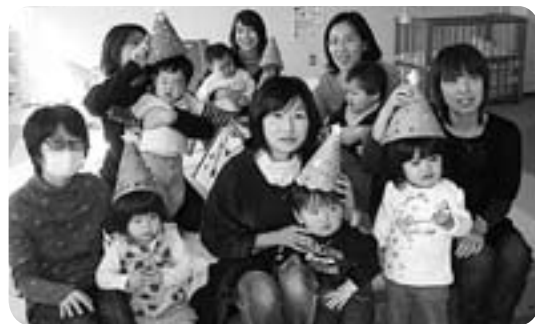
1歳児のお部屋(クリスマス飾り作り)