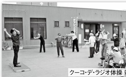
クーコ・デ・ラジオ体操