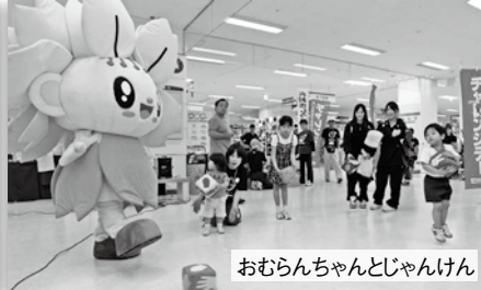
おむらんちゃんどじゃんけん