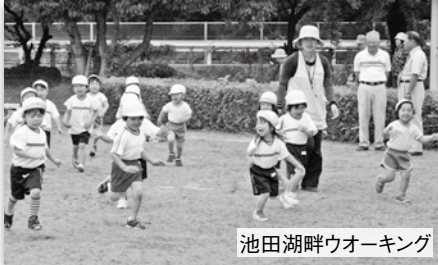
池田湖畔ウォーキング