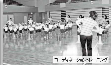
コーディネーショントレーニング