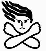
女性に対する暴力根絶のためのシンボルマークです。

暴力は決して許されるものではありません。特に、配偶者などからの暴力(DV=ドメスティック・バイオレンス)、性犯罪、売買春・人身取引、セクシュアル・ハラスメント、ストーカー行為など女性に対する暴力は、女性の人権を著しく侵害するものであり、男女共同参画社会を形成していくうえで克服すべき重要な課題です。