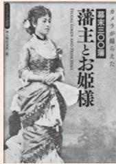
新人物往来社 編 新人物往来社