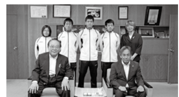
岐阜県で開催された第12回全国障害者スポーツ大会に県代表として出場した選手の皆さん (9月27日)