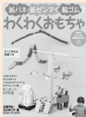
近藤 芳弘 著 PHP 研究所

幕末から明治にかけての激動の時代を生きた大名と姫君たちのエピソードを、多数の写真とともに紹介した1冊です。上野彦馬撮影の大村純熙公とその家族の写真も掲載。