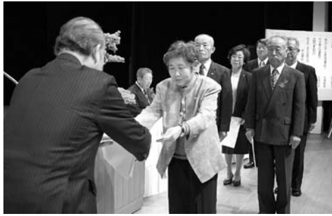
市長から委嘱状が伝達されました。(11/28・さくらホール)

民生委員・児童委員が決まりました。平成19年12月1日〜平成22年11月30日までの3年間、市民の皆さんの生活に関する相談、援助、指導など、市民の福祉増進のために活動していただきます。 ※( ) 内は担当地区