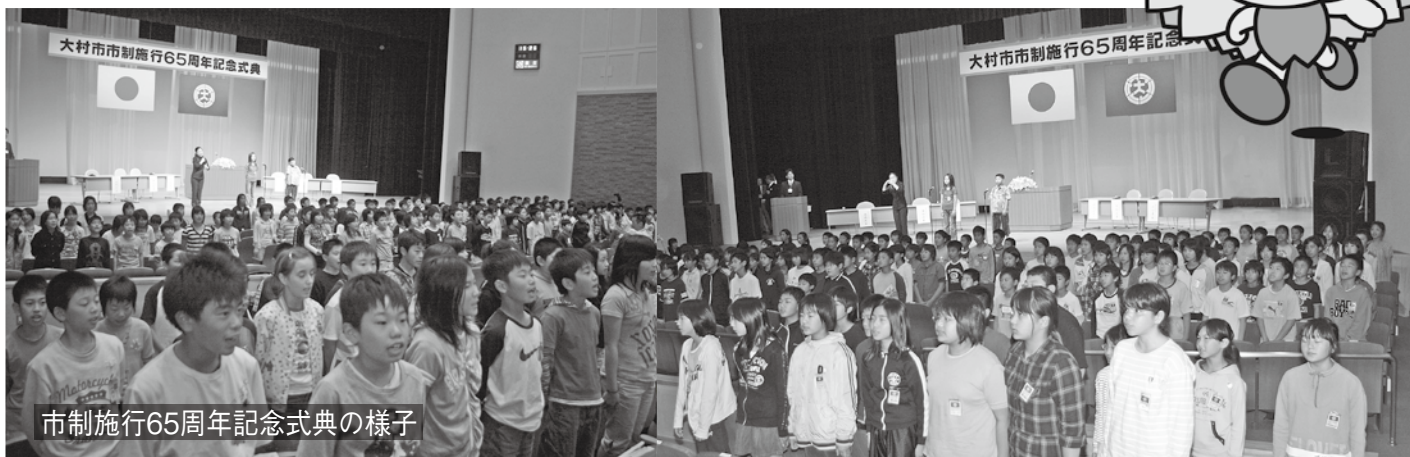
市制施行65周年記念式典の様子