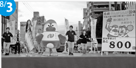
カウントダウンボードは市役所玄関前に設置しています!