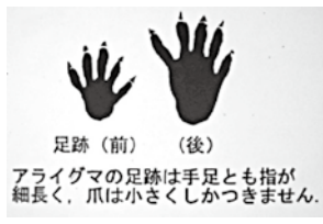
▲アライグマの足跡