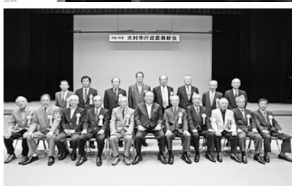
■地域げんき課(内線185)