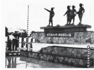
4少年の勇気を讃えて —天正遣欧少年使節銅像が完成—