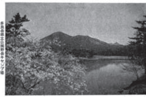
多良山系 この頃は主にキャンプ場としてにぎわっていたそうです。現在は公園として整備していますが、多良岳を望む癒しの風景は変わっていません。