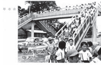
大村公園入口の玖島交差点に歩道橋ができたこと報じています。現在は撤去されていますが、今でも交通量の多い主要交差点です。