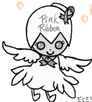
ピンクリボン運動 マスコットキャラクター「ピリンちゃん」