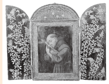
南蛮漆器聖フランシスコ聖龕