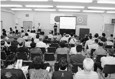
大村地区の地元説明会のようす(7月1日/市役所)

この説明会は、建設主体である独立行政法人鉄道建設・運輸施設整備支援機構が中心線測量を前に新幹線ルート計画にある沿線住民などを対象に行ったもので、同機構が中心線測量から開業までの計画について概要を説明しました。 参加した市民からは、建設ルートの確認や開通後の騒音や振動などの環境問題などについて質問がありました。