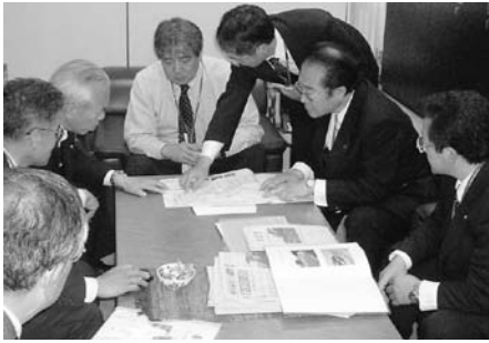
国土交通省・道路局への要望状況(6月4日)

このうち国土交通省では、「ちやくちやくプロジェクト選定区間の水主町交差点（今年度完成予定）および国立医療センター入口交差点（平成22年度完成予定）の2区間については、それぞれの完成年度へ向けて全力を挙げて事業推進したい」と話されました。 期成会では、引き続き各方面との協力体制を強化し、全区間の早期完成を目指します。