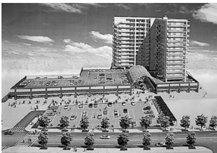
再開発事業の完成予想図

総会に出席した松本市長は、関係者のこれまで労をねぎらうとともに、「再開発事業が中心市街地活性化の起爆剤になることを期待しています」とあいさつしました。