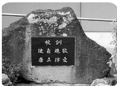
校訓(健康・自立・規律・敬愛)

特色ある行事としては、12月に行う「 玖島フェスティバル 」があります。「命」や「平和」「人権」をテーマにして総合学習などで調べた内容や作った作品の発表会を行い、3年生は劇にも取り組みます。毎年多くの保護者や地域の方に見に来てもらい盛り上げます。 他にも「 玖島ゼミナール 」と銘打って、地域の人や保護者の方などが得意とする内容で講師になつてもらい、生徒はもちろん保護者や先生方も対象に行う講座を年間に2回7月と2月に行います。茶道、着物の着付け、陶芸、手話、竹細工、人工呼吸法など盛りだくさんのコースがあります。