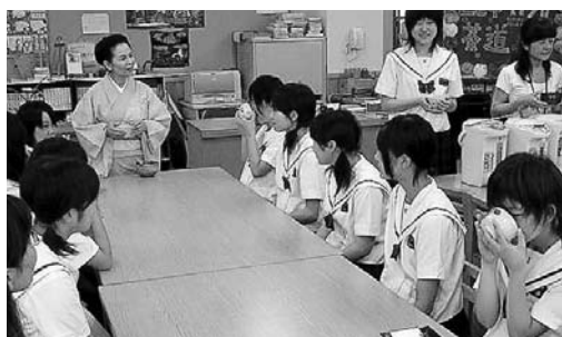
玖島ゼミ：生徒・保護者が茶道に挑戦

特色ある行事としては、12月に行う「 玖島フェスティバル 」があります。「命」や「平和」「人権」をテーマにして総合学習などで調べた内容や作った作品の発表会を行い、3年生は劇にも取り組みます。毎年多くの保護者や地域の方に見に来てもらい盛り上げます。 他にも「 玖島ゼミナール 」と銘打って、地域の人や保護者の方などが得意とする内容で講師になつてもらい、生徒はもちろん保護者や先生方も対象に行う講座を年間に2回7月と2月に行います。茶道、着物の着付け、陶芸、手話、竹細工、人工呼吸法など盛りだくさんのコースがあります。