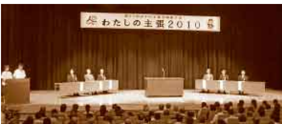
少年の主張長崎県大会