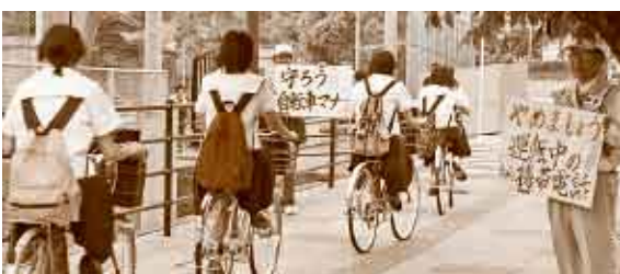
自転車マナーアップ運動