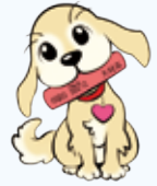
自殺対策キャラクター 「大村市いのちをつなぐまもるくん」

国内では2万人以上が自ら命を絶っています。追い込まれる前に、誰かに援助を求めることが大切です。つらいとき、くるしいとき、ふあんなとき、なやんだとき、ひとりでかかえこまず、だれかにはなしてみませんか。