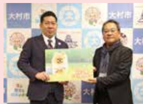
市内の教育保育施設・小中学校へ (カレンダー贈呈) ▶(株)オムロプリント