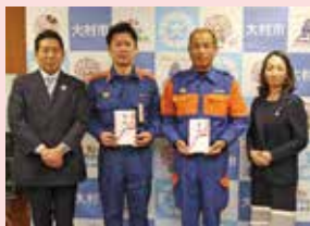
市消防団・消防署へ(寄附) ▶(株)シンコー