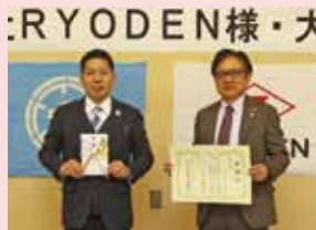
市へ (企業版ふるさと納税) ▶(株)RYODEN