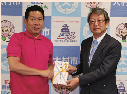
市へ(企業版ふるさと納税) ▶ 三機化工建設株式会社