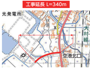
①市道杭出津松原線(寿古町)