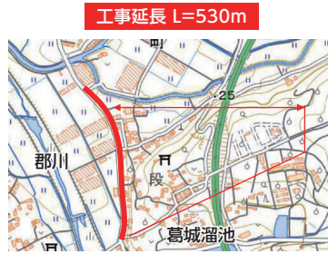
②市道坂口皆同線(今富町)