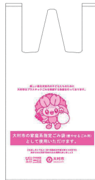
実証事業で販売する 家庭用指定レジごみ袋