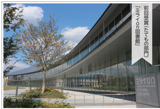
前回受賞(たてもの部門)「ミナト図書館」

市ホームページからダウンロードした応募用紙または募集中ラシ裏面申込書に必要事項を記載の上、持参・郵送・ファクス・メールのいずれかの方法で提出