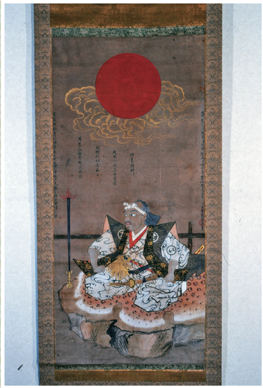
深澤儀太夫勝清肖像画 (個人所蔵)