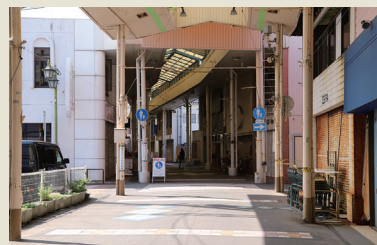
c 大村中央商店街 (東本町)