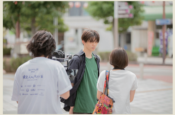
b 大村バスターミナル周辺 (東三城町)

撮影が夏越まつりの時期だったこともあり、シーンのところどころにお祭りの気配が見え隠れ。