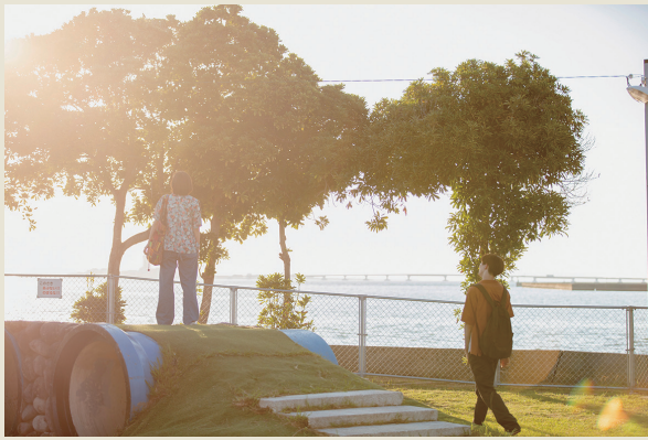
a 幸町公園 (幸町)