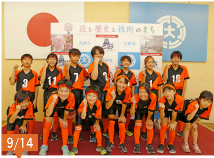
第9回九州ブロック親善ドッジボール大会(鹿児島県)に出場される、旭フェニックスの選手の皆さん。