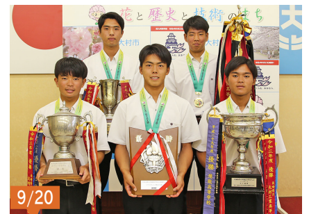
第57回全日本高等学校男子ソフトボール選手権大会(高知県)に出場し優勝された、大村工業高校ソフトボール部の選手の皆さん。