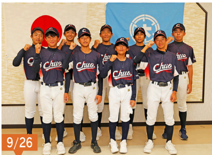
西日本選手権野球大会(熊本県)と西日本新聞社旗争奪!トルシニア九州連盟夏季大会(福岡県)に出場された、長崎中央トルシニアの選手の皆さん。