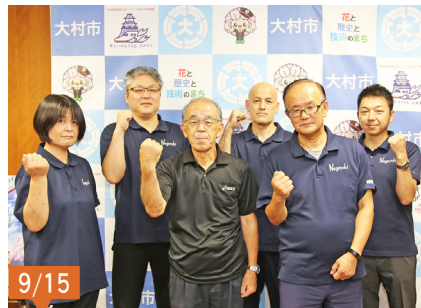
日本スポーツマスターズ2022岩手大会(バレーボール)に出場される、大村東彼クラブの選手の皆さん。