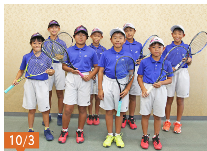
西日本小学生ソフトテニス選手権(香川県)と九州小学生ソフトテニス選手権大会(宮崎県)に出場される、大村なんてジュニアクラブの選手の皆さん。