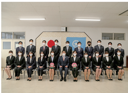
新規採用職員20人に辞令を交付しました。市民の皆さんよろしくお祈いします。