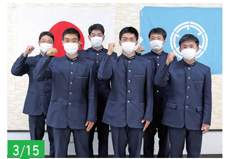
第40回全国高校男子ソフトボール選抜大会(岐阜県)に出場される大村工業高校ソフトボール部の選手の皆さん。