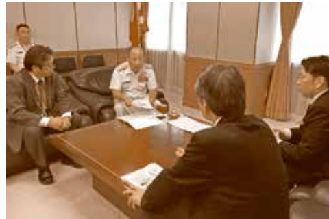
← 河野克俊統合幕僚長との面談の様子