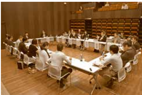
← さまざまな分野で取り組んでいる活動を発表