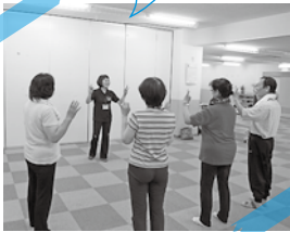
特定健診後の運動教室