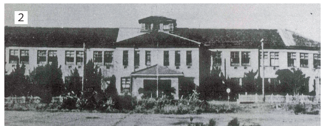
1 炎上する第21海軍航空廠 2 航空廠本部庁舎

の構造物は鉄がむき出 しになったり、燃えたり 見るも無残に。爆弾が落 下したところは大きな 穴があき、馬がその中で 死んでいた。」と当時の惨 劇を振り返ります。