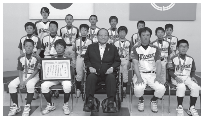
「第20回高野山旗全国学童軟式野球大会」(和歌山県)に、県代表として出場した北大村ウイングス少年野球クラブの選手・監督の皆さん (6月23日)