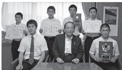
剣道の「第30回おおむら菖蒲まつり少年大会・全九州少年優勝大会」中学の部で、見事初優勝を成し遂げた玖島中学校剣道部の皆さん (7月3日)