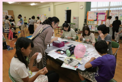
男女共同参画推進センター ☎048715