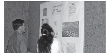
ご応募いただいた18点のサクラの絵は、姉妹都市・秋田県仙北市の「角館の桜まつり」期間中、平福記念美術館に展示されました。