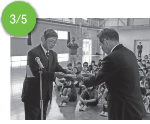
3/5 ▲一般社団法人長崎県LPガス協会から、市内小学校4校へSiセンサーコンロを寄贈していただきました。