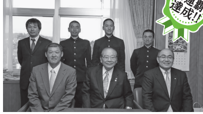
第33回全国高等学校男子ソフトボール選抜大会(静岡県)に出場した大村工業高校男子ソフトボール部の皆さん (3月16日)