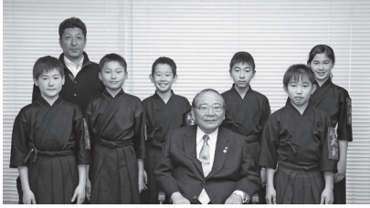
第56回全国選抜少年剣道錬成大会(茨城県)に出場した大村市剣道協会チームの皆さん (3月23日)