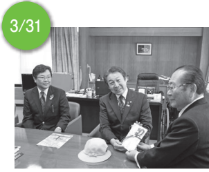
3/31 ▲大村ライオンズクラブから、小学校新一年生へ通学帽子を寄贈していただきました。