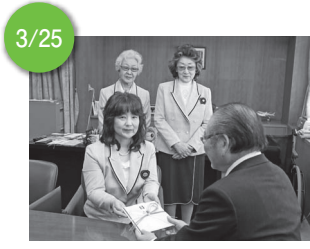
3/25 ▲国際ソロプチミスト大村から、市と市内の中学校、市立図書館へ図書などを寄贈していただきました。