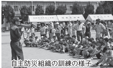
自主防災組織の訓練の様子