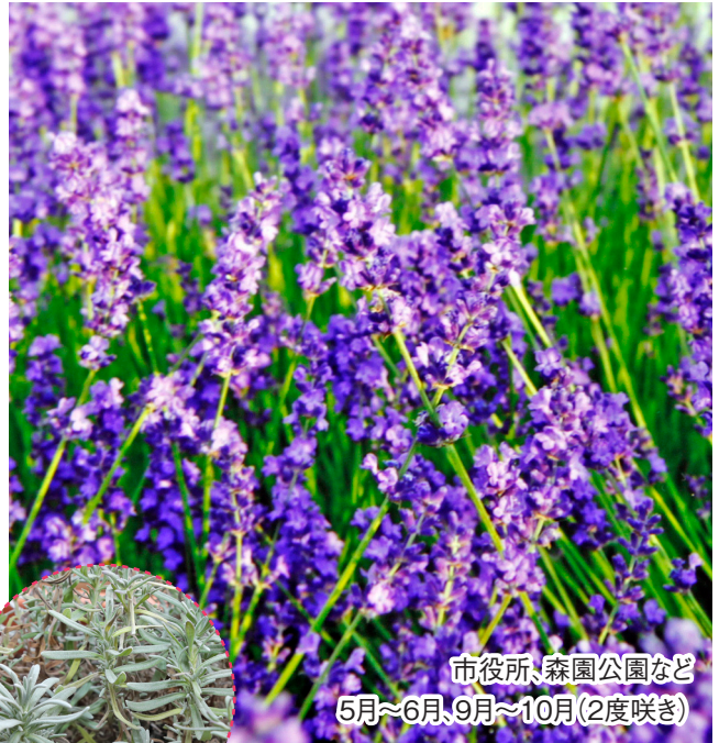
市役所、森園公園など 5月～6月、9月～10月(2度咲き)

これから夏にかけて、大村はたくさんの方が咲き誇ります。普段気づかないかもしれません、美しく咲く花々には、いろいろな人たちの思いが詰まっています。一年という長い時間と惜しみない愛情が込められた大村の花々。その思いを感じながら花を眺めると、いつもと違った景色が見えてくるかもしれません。 皆さんの込められた思いがあるからこそ、華やかな大村の春がやってくるわけです。3月25日から「おおむら花まつり」が始まります。