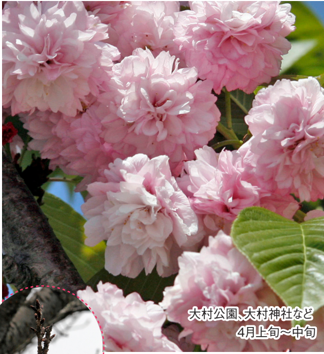
大村公園、大村神社など 4月上旬～中旬