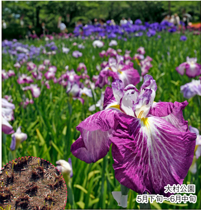
大村公園 5月下旬~6月中旬