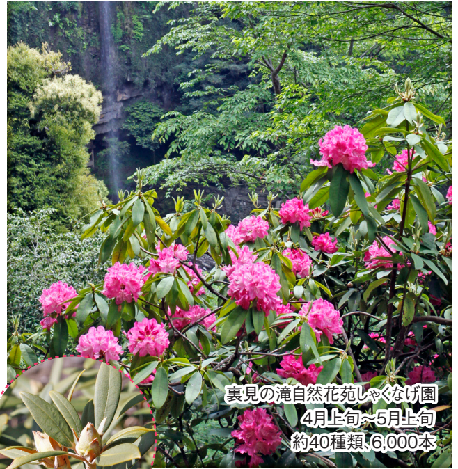
裏見の滝自然花苑しゃくなげ園 4月上旬~5月上旬 約40種類、6,000本

雨の日がおすすめ。家に閉じこもりがちな時期ですが、雨にぬれた花は情緒があって思わず見とれます。