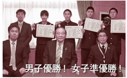
男子優勝！女子準優勝！

第67回全日本バレーボール高等学校選手権大会(春高バレー:東京都)に出場した大村工業高校男子バレーボール部の皆さん (1月15日)