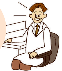
■国保けんこう課(内線140)

COPD は、健康増進に重要な疾患であり、予防可能な生活習慣病ですが、認知度は低い状況です。COPD の疑いがある場合は、早めに医療機関を受診し、早期発見と適切な治療を受けましょう。