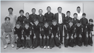
第49回全国道場少年剣道大会(東京都)に出場した三浦中央少年剣道クラブ、放虎原少年剣道クラブの皆さん (7月22日)