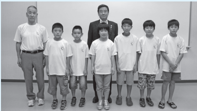
平成26年度全日本少年少女武道(剣道)錬成大会(東京都)に出場した大村市剣道協会チームの皆さん (7月22日)