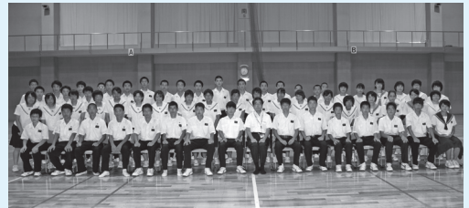
平成26年度九州・全国中学校体育大会に出場した大村市選手団の皆さん (7月30日)