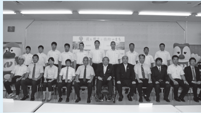
平成26年度全国高等学校総合体育大会(東京都ほか)に出場した大村工業高校バレーボール部、ソフトボール部、アーチェリー部、レスリング部、体操部の皆さん (7月16日)