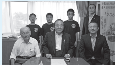
第30回わんぱく相撲全国大会(東京都)に出場した福重小学校の皆さん (7月25日)