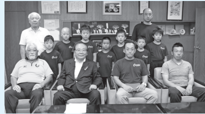
第31回全国少年少女レスリング選手権大会(東京都)に出場した大村ジュニアレスリングクラブの皆さん (7月15日)