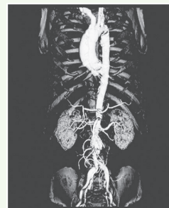
胸腹部の大血管の造影後の3D写真

方向から写真を確認できるので、血管の病気の治療前後やレントゲンではわかりにくい小さな骨折にCT検査が役立ちます。