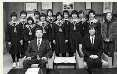
第31回九州中学校バレーボール選抜優勝大会(島原市)に出場した桜が原中学校女子バレーボール部の皆さん (2月20日)