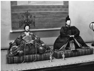
旧藩主 大村家のひな人形