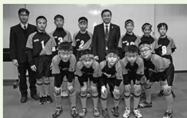
第23回春の全国小学生ドッジボール選手権九州大会(宮崎県)に出場した旭が丘ドッジボールクラブの皆さん (2月13日)