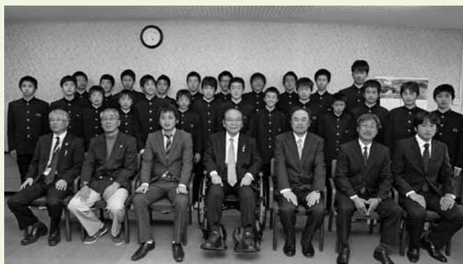
第27回九州中学校(U-14)サッカー大会(宮崎県)に出場した郡中学校サッカー部の皆さん (3月7日)