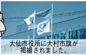
大仙市役所に大村市旗が掲揚されました。

結果は、目標の参加率70%は達成できませんでしたが見事大仙市に勝利し、参加率50%を超える自治体に贈られる金メダルも、6年連続で獲得することができました。