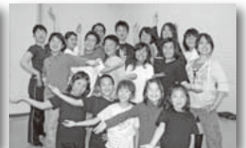
ミュージカル劇団夢桜