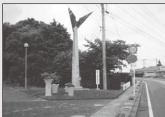
非核・平和都市宣言の碑

長崎、広島で原爆や戦争の犠牲になられた人たちのご冥福を祈って、サイレンを鳴らします。黙とうをささげ、平和への誓いを新たにしましょう。